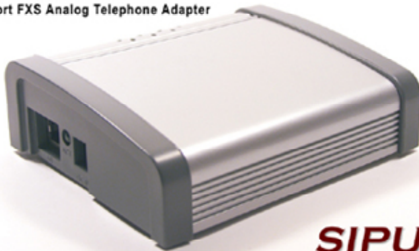
SPA-2000 2 Port FXS Analog Telephone Adapter

Este guia descreve o uso básico do adaptador de telefone SPA-2000 da tecnologia Sipura -uma voz sobre IP inteligente de baixa densidade. O SPA permite tanto a classe residencial quanto a classe de negócios de telefonia IP fazerem conexões de alta velocidade broadband através da Internet. Por ser inteligente, nós concordamos que o SPA mantém os estados de todas as chamadas que termina. É capaz de fazer decisões apropriadas na reação aos eventos de entrada do usuário (tais como o colocar o telefone no gancho ou o flash de ligar/desligar do gancho) com quase nenhuma participação de um servidor de usuário ("middle-man") ou de controle de mídia da gateway.